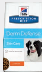
Hill's Prescription Diet Derm Defense