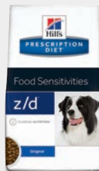
Hill's Prescription Diet z/d