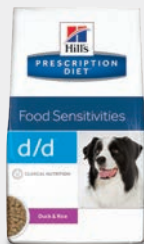
Hill's Prescription Diet d/d